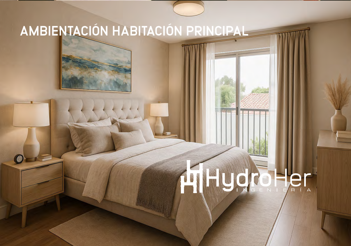
AMBIENTACIÓN HABITACIÓN PRINCIPAL